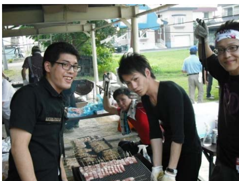
ダイナム帯広店 「東陽夏祭りへの協賛」