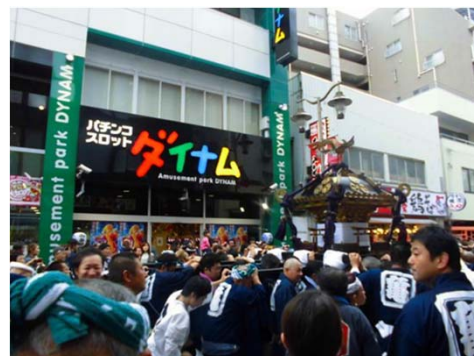
ダイナム亀有店 「亀有香取神社例大祭への協賛」