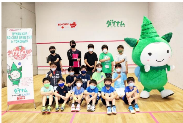
小学生 高学年の部（4年生～6年生）16名

今回のダイナムCUPから、将来の競技人口の拡大・未来のトッププレイヤーの育成を目指して小学生の部（高学年・低学年）を新設いたしました。試合では大人顔負けのプレーを展開し、優勝・準優勝の選手には人気ゲームソフトやメダルが贈られました。