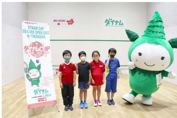
小学生 低学年の部（2年生～3年生）4名