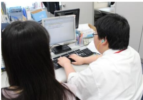
当社従業員と確認しながら、 会議録音を聞き取り議事録へ入力する様子