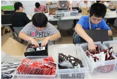
商品の箱詰め作業