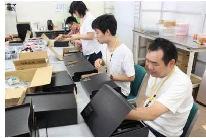
化粧箱の仕切り作り