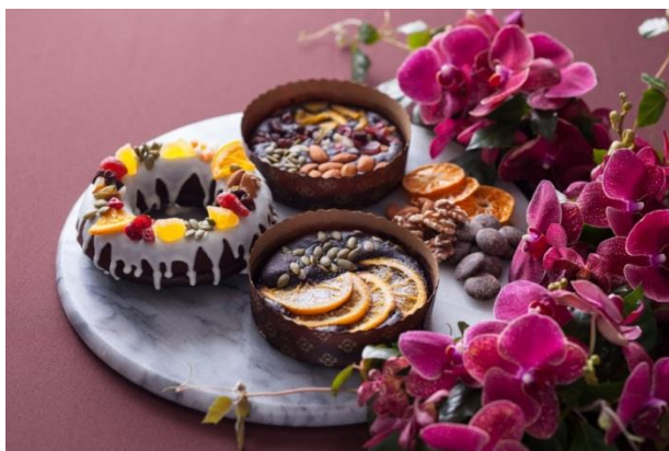
『スイーツ作り体験教室×椿ランチbuffet』

心おどるバレンタインデーに、ふたりの絆をより強めるホテルならではの特別なプランをご用意し、大切な人と過ごす忘れられない一日をお楽しみください。