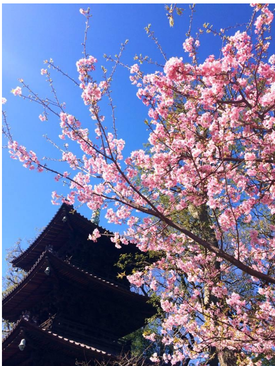
三重塔と2月に見頃を迎える河津桜