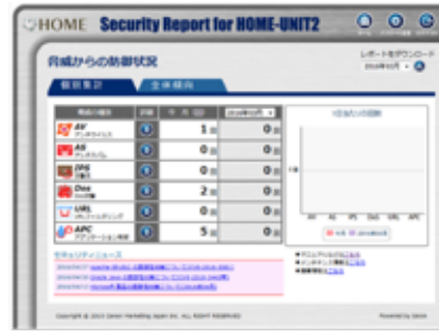
見える化サイト(表示例)