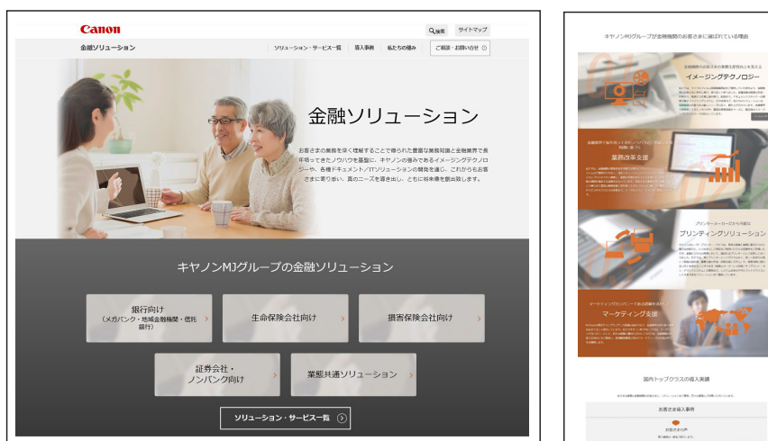
金融ソリューションサイト：URL: canon.jp/fps