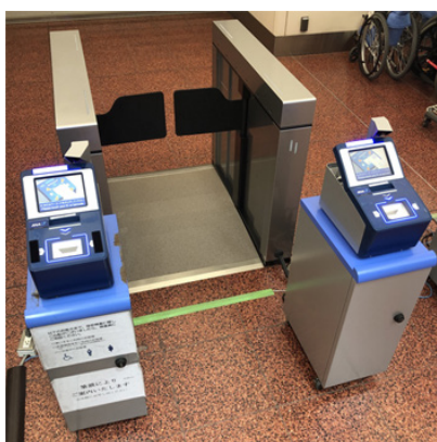
「フラッパー付き自動ゲート」

キヤノン MJ は、今後も業種・業務に特化したデジタルソリューションの提供を強化し、お客さまの様々な業務の DX を支援していきます。