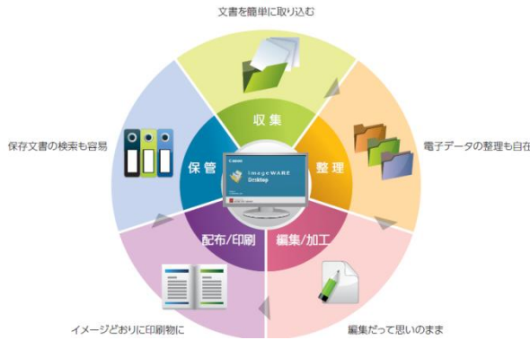
“imageWARE Desktop “概略図

キヤノンマーケティングジャパン株式会社（社長：坂田正弘、以下キヤノン MJ）は、ドキュメントハンドリングソフトウェア”imageWARE Desktop “の新バージョンを2015年7月9日より提供開始いたします。