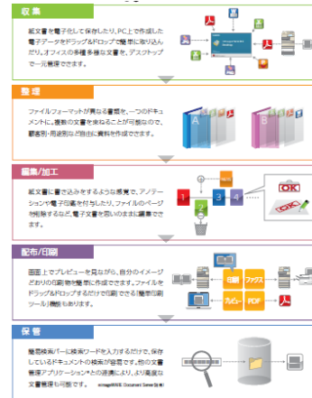
“imageWARE Desktop “特長

“imageWARE Desktop” は、キヤノンの複合機 “imageRUNNER ADVANCE” と連携することで、オフィスにおける一連のドキュメントフローをサポートし生産性向上とコスト削減を可能にする PC アプリケーションです。紙文書や電子データなどのさまざまなデータを簡単に取り込み一元管理ができるだけでなく、異なるファイルフォーマットのデータをひとつのドキュメントに集約することができます。また、データの編集、加工、印刷に加え、保存したドキュメントの検索も容易にできる機能を備えています。