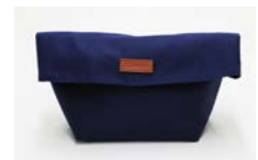
バッグインバッグ