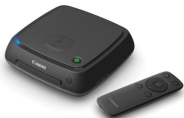
Connect Station CS100