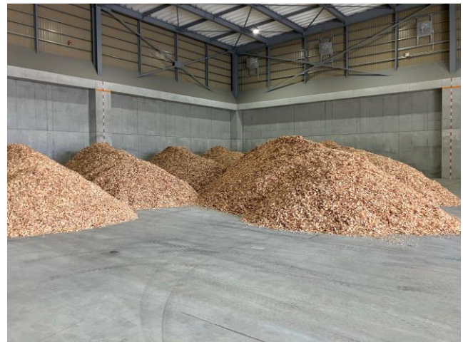
使用予定の地元産木質チップ

Daigas グループは2050年のカーボンニュートラル実現に向け、2030年度までに自社開発や保有に加えて、他社からの調達も含めて、国内外で500万kW*の再生可能エネルギー（以下「再エネ」）電源の普及に貢献することを目指しています。今後も、再エネの電源開発及び再エネ電気の供給を通じて、低・脱炭素社会の実現に貢献してまいります。