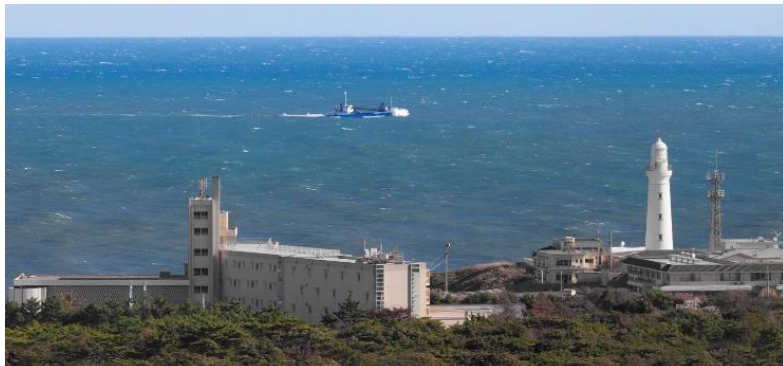
※絶景の宿 犬吠埼ホテル（手前左）と犬吠埼灯台