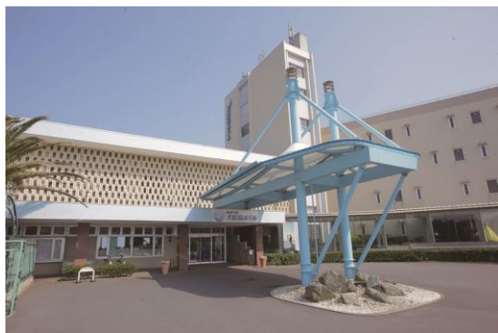
※絶景の宿 犬吠埼ホテル外観