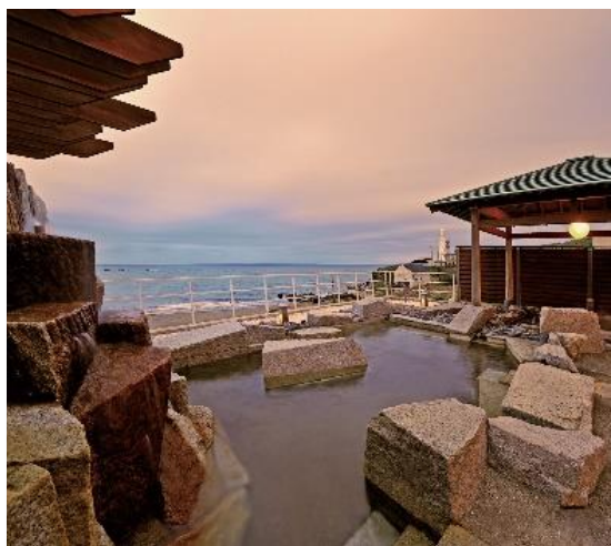
※露天風呂『黒潮の湯』