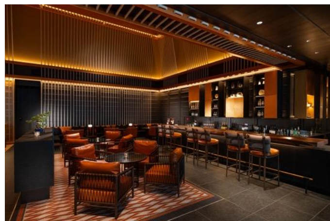
ロビーラウンジ&バー「LATTICE LOUNGE」