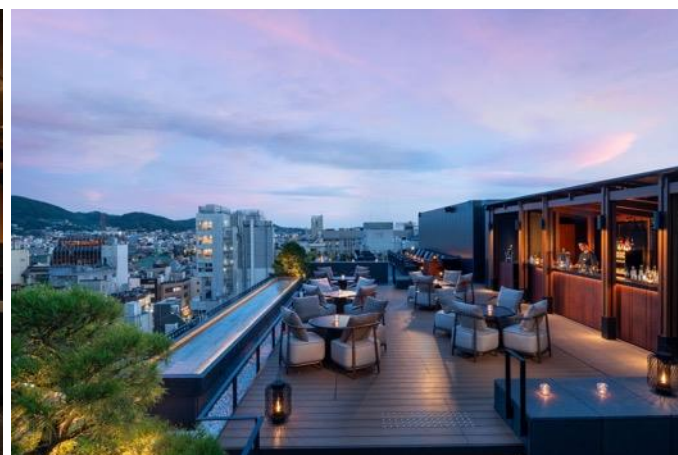
ルーフトップバー「CLOUD NEST ROOFTOP BAR」