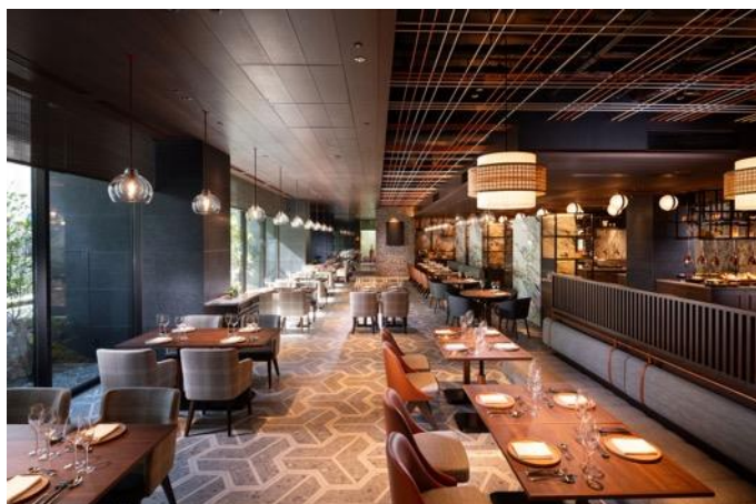
オールデイダイニング「Téori」