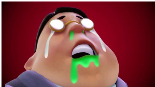
【ワサビ入りのお茶を飲んで鼻水を垂らすホンダ】