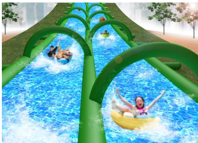
【ハイドロスライダー イメージパース】

ゲームやSNSなど、仮想体験や仮想交流に楽しみを見出す社会風潮が蔓延する中、友人や家族、新しく出会った人と、数々の驚き体験アトラクションを通じて喜びを分かち合い、現実体験と温かい交流で絆を強めることを提案するテーマパークです。