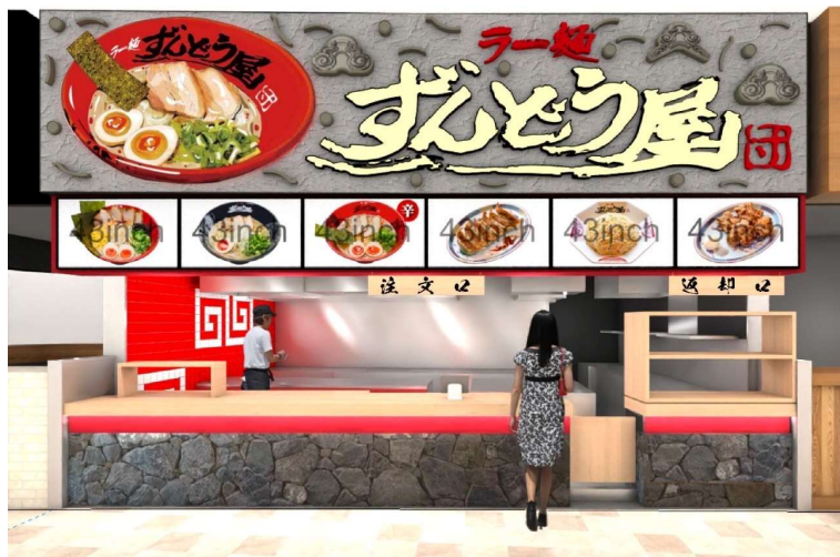
※画像はイメージとなります

兵庫県・姫路で誕生した「ラー麺ずんどう屋」は、現在兵庫県内に24店舗を出店しており、今回が25店舗目の出店となります。発祥の地・兵庫で、創業当時から大切にしてきた「姫路濃厚豚骨」の味と想いを、より多くの地元のお客さまへお届けしたいと考えております。これからも地域に根ざし、長く愛される一杯を提供し続けてまいります。