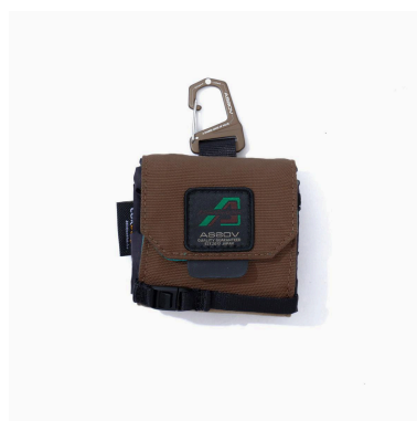
PACKABLE DRINK HOLDER ¥6,050税込