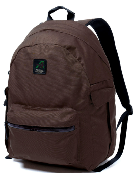
DAY PACK ¥28,600税込

スタンダードなデザインアイテムだからこそちょっとひねった配色も魅力です。内装はグリーンにすることで、外からチラッと見えた時や、ジッパーを開けた時にアクセントとなっています。