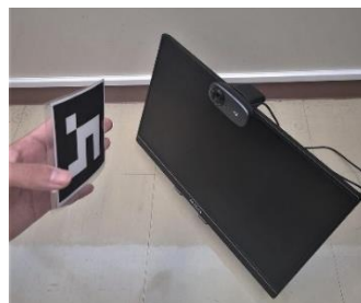
ARマーカー(左)の図形で ドローンを制御

ドローンの正しい知識と操縦スキルを有した人材育成や普及活動などの事業を展開しているファーストパーソンと体験イベントや施設管理、点検などの保守業務にもドローンを活用したいと考えているミズノが本学とタッグを組み開催するイベントです。ドローンと情報科学技術を活用した「新たな学びの方法」を通じて、未来の社会インフラ化を見据えたドローン活用の普及を目指しています。