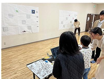
学生のサポートを受け、 高得点ルートを考える子供ら