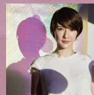
スツニ子! アーティスト