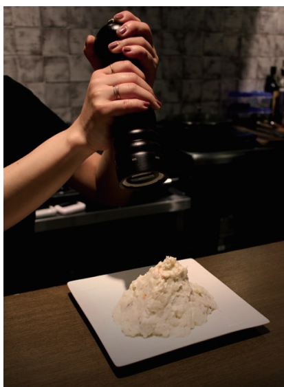
お酒に最高に合う、黒いスパイスを好きなだけ振りかけてくれる「黒いポテサラ」