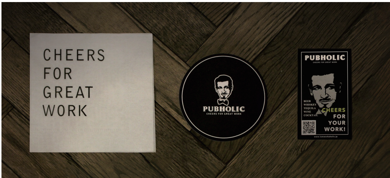
SNS映え間違いなしのグラフィックツール