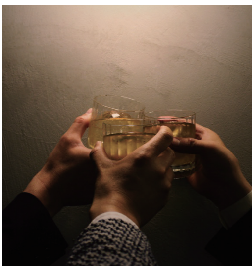
仕事終わりの最高の一杯を「PUBHOLIC」で