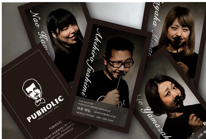
PUBHOLIC オリジナルTシャツを着たパブマスターとスタッフ