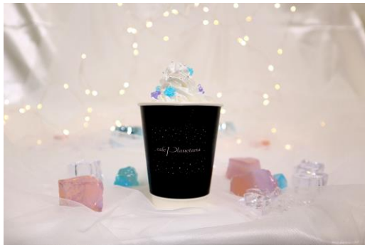
スノーフレークチャイティー