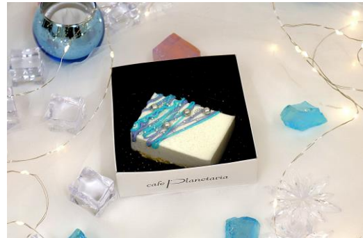
氷の星のチーズケーキ