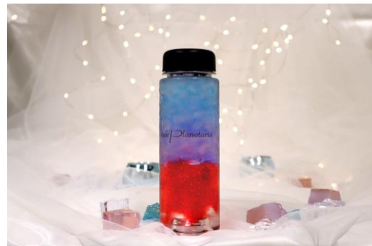
スターリーボトル クリスタル