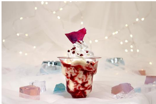
フレイムパンナコッタ