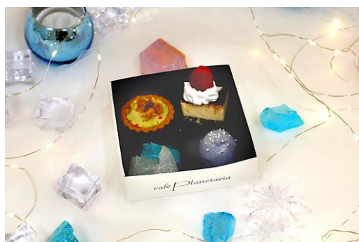
アイスパビリオンアソート