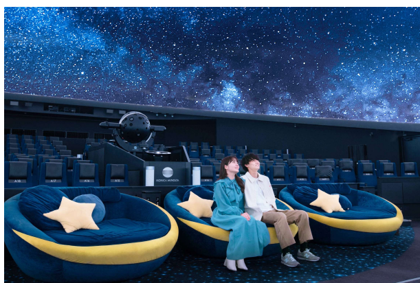
3 席限定の三日月シートはカップルや親子に人気

以来、アロマが香るヒーリング作品、アーティストや人気アニメとのコラボ作品、ストーリー性のある作品や生演奏を楽しめる作品など、多種多様なプラネタリウム作品を上映し、訪れる方それぞれが特別な体験を通じて『今、ここにいる奇跡』を体感できるエンタテインメント施設としてご愛顧いただいています。