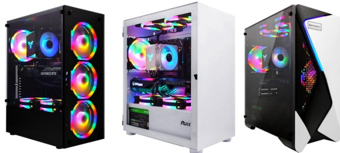
ゲーミングPCが初めての方でも安心のサポート体制

当社のサポートは購入前相談から購入後の不具合対応、些細なトラブルシューティングの依頼、修理受付などを行います。電話でのサポートを行うほか、緊急時や電話での対応が難しい場合は駆けつけサポートを実施することも可能です。電話・リモートサポートを年間16万件以上対応している当社による対応で困った時にも電話でお困りごとを解決に導き、ユーザーの多様なニーズに柔軟に対応し、初めての購入を検討する人から、機器を長く使い続けたいユーザーまでライフスタイルに寄り添ったサービスを展開してまいります。