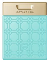
イイスタンダード トリートメント ポジティブリペア 250ml ¥3,630