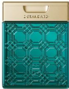
イイスタンダード シャンプー スカルプ 250ml ¥3,630