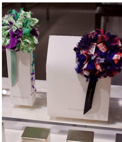
ギフトボックス 左) ¥330 税込 右) ¥550 税込

2026 年 5 月より、＜E STANDARD (イイスタンダード)＞のヘアケアプロダクトの取り扱いを開始いたします。