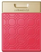
イイスタンダード トリートメント キューティクルニュートリション ダマスクローズ 250ml ¥3,630