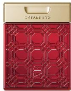
イイスタンダード シャンプー ダマスクローズ 250ml ¥3,630