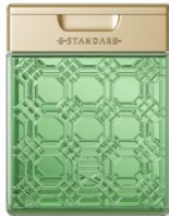
イイスタンダード シャンプー ポジティブリペア 250ml ¥3,630