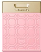
イイスタンダード トリートメント メデュラニュートリション ダマスクローズ 250ml ¥3,630