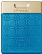
イイスタンダード トリートメント スカルプ 250ml ¥3,630