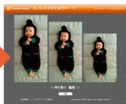
②同画面で画像もトリミング可能！