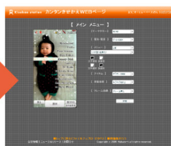
③同画面で詳細なレイアウトを決定後データ送信