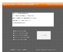
①オーダー発注画面から画像をアップロード

従来のきせかえコンテンツ制作においては、モチーフのデザイン⇒素材作成⇒機種展開⇒実機検証を行わねばならず、3 キャリア 300 端末で展開すると、2010 年における一般的な業界の相場では 100 万円程度の制作費がかかりました。その制作工程を見直し、今まで合理化できなかったデザインと素材作成のコストさえも不要という、従来の常識を覆した制作サービスとなります。価格は 3 キャリア 300 機種種のスポットで約 10 万円(税別)。年間契約の月間作り放題プランなら 1 万円で制作可能です。2010 年相場の 10 分の 1 から 100 分の 1 以下できせかえコンテンツの制作が可能となりました。