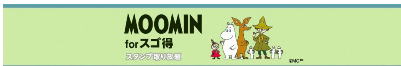
『ムーミン for スゴ得』イメージ