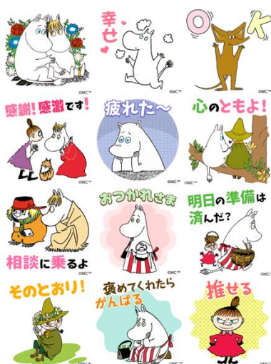
スタンプイメージ