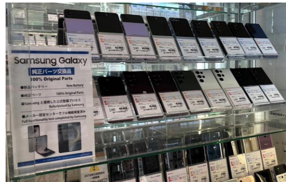
<店頭で販売する Samsung Galaxy シリーズのリファービッシュ品>

本製品は、2025 年 12 月 13 日（土）より、ゲオモバイルの一部店舗（全国 3 拠点）およびゲオ公式 EC サイト「ゲオオンラインストア」( https://ec.geo-online.co.jp/shop/ )にて取り扱いを開始し、順次拡大予定です。リファービッシュ品の取り扱いを通じて、これまで「バッテリーの持ち」や「見えない不具合」への懸念から中古スマホを敬遠していたお客さまへ、安心して選べる新たな選択肢を提供します。