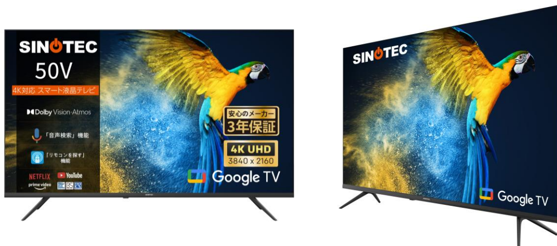
<『SINOTEC 4K対応50V型液晶スマートテレビ』製品画像>

ゲオは、生活向上に役立つ各種グッズをオリジナルブランドとして積極的に展開し続けています。今般のスマートテレビも、その一環として販売します。