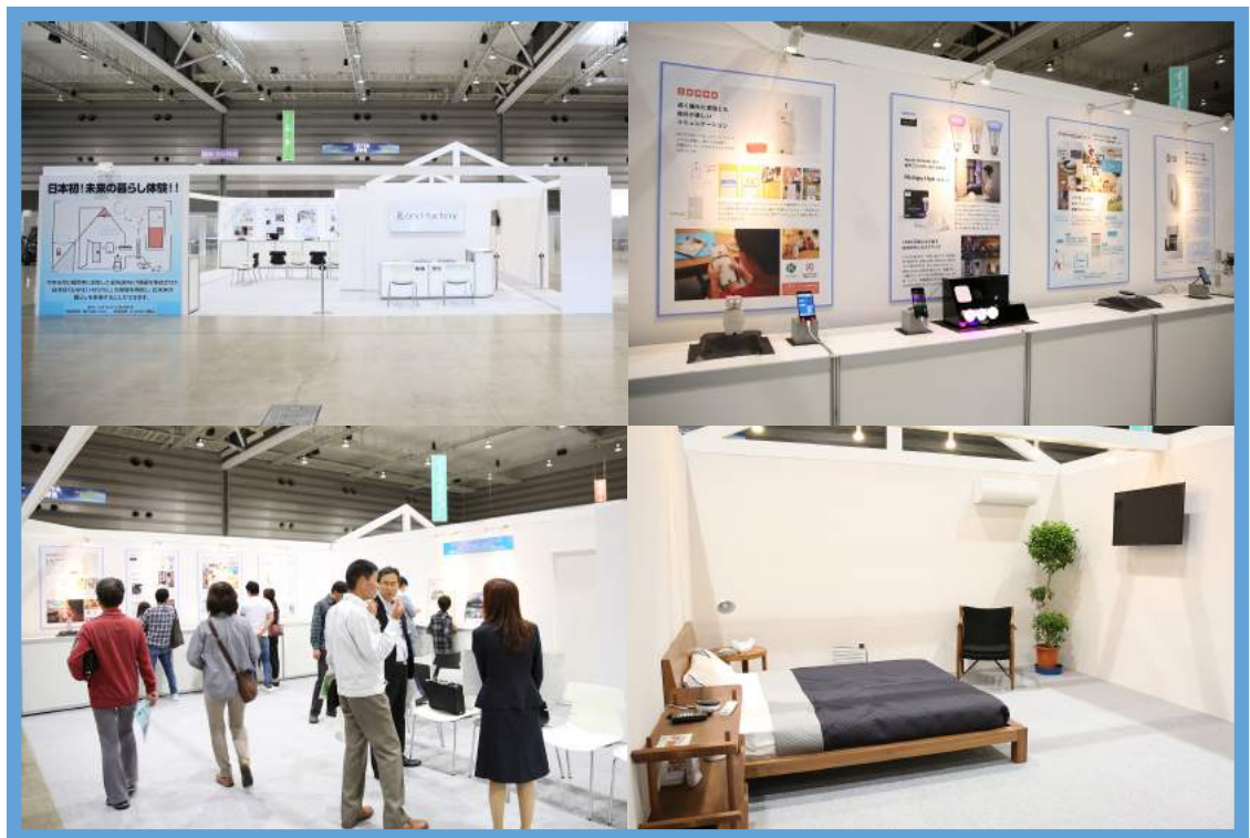
会場風景 & 未来の暮らし体験部屋

日本初のIoT体験型宿泊施設として、今年8月上旬に福岡市博多区に開業した「&AND HOSTEL」。その施設内に組み込まれているIoT デバイスを連結させ、統制・制御するアプリケーションとして「&IoT」は開発されました。本アプリケーションは汎用性が高く「&AND HOSTEL」以外でも様々なシーンに合わせた IoT 体験が可能であり、こおりやま産業博においては宿泊ではなく【未来の暮らし】を体験する設計を行い、ブース出展を致しました。