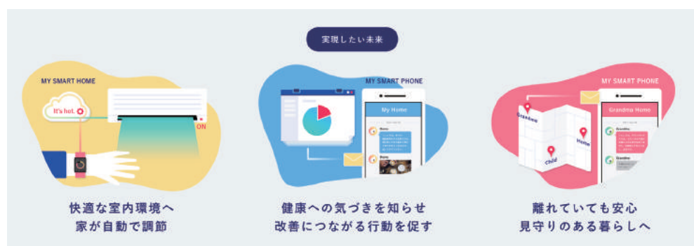
AIを通じて居住者の状態に合わせた快適な室内環境へ自動調節する未来の家イメージ

未来の家プロジェクトWebサイト： http://mirainoie-project.jp/