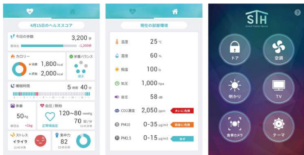
アプリケーションイメージ

従来、健康管理に関わるバイタルデータや食事などのデータは、各種多様なデバイスを用いて収集、計測は行われていますが、それぞれのデータを一元的に見ることができないことや、使用者自身がデータ入力するのが手間になり、継続して使われづらいという課題がありました。IoTスマートホーム TM では、複数のデータをクラウド上に収集し、スマートフォンなどの一つの管理画面で可視化されるため、居住者は手軽に健康や生活状態を把握できます。さらに、居住者はIoT機器などを一括で制御、管理できるアプリケーションを用いて、手軽に家の中に設置されているIoT機器などの操作が可能になります。