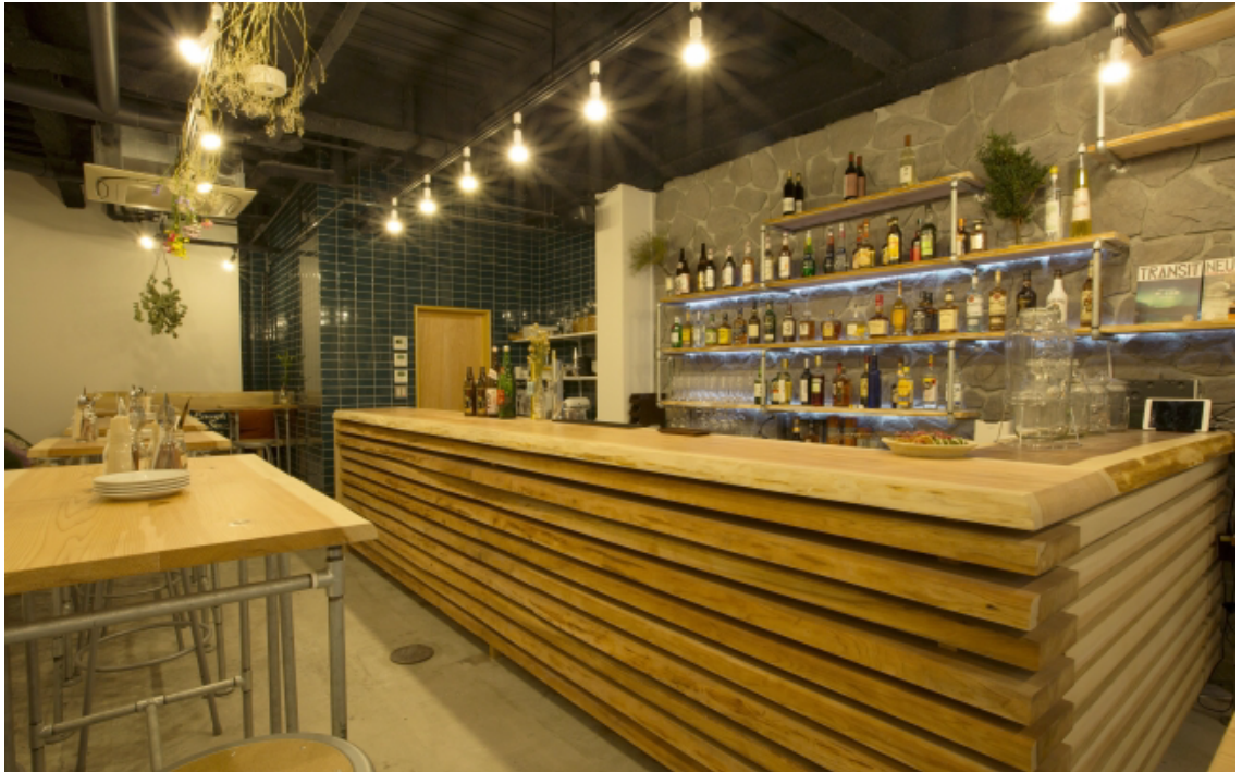
食事とコミュニケーションが楽しめるダイニングカフェ