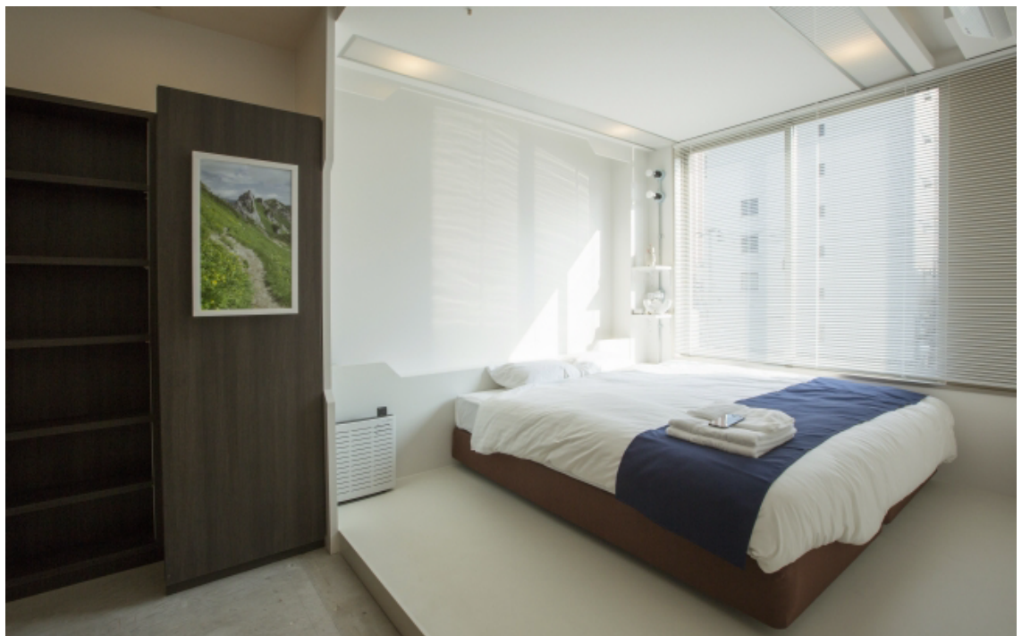
随所に IoT デバイスを配した客室

九州大学をはじめ、日本初の取り組みにご賛同を頂いている研究機関・NPO 法人・IoT デバイスメーカーと連携を図り、我々は「&AND HOSTEL」をこれまでの宿泊施設の概念を超えた IoT を基軸としたスマートホテルブランドとして成長させて参ります。