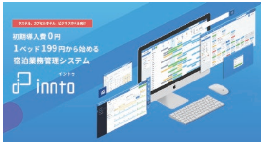
innto サービスサイト・・・ https://innto.jp

これら 3 つのサービスの連携により、宿泊者の詳細な属性を判別した上での快適な居室環境設定が可能になり、最適なコンテンツ配信、広告配信が最適化されます。これにより、ゲストの宿泊体験価値やビジネス構造自体の進化を目指します。