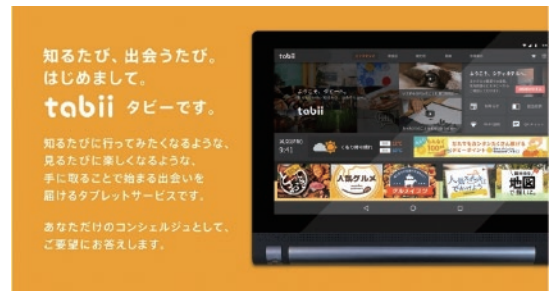
tabii サービスサイト・・・ http://tabii.tech