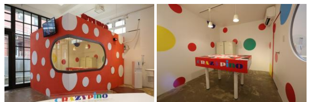
「CRAZYpino STUDIO」内の公開収録スタジオ

「CRAZYpino CONTEST」の開催で、多くの方々に 「CRAZYpino」を体験していただきました。「CRAZYpino」を気軽 に楽しめる体験型スポットとして7月20日(土)～8月4日(日)に東 京・原宿でオープンした「CRAZYpino STUDIO」には、動画クリ エーターを対象とした無料・公開収録スタジオを設置し、多くの 動画クリエイターにスタジオを利用していただきました。