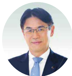
奈良県知事 山下 真