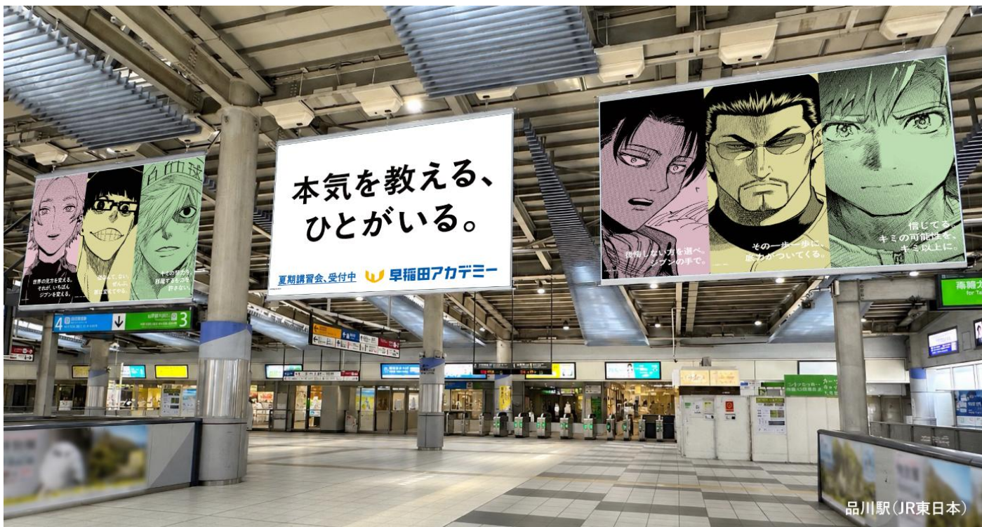
©山口つばさ ©金城宗幸・ノ村優介 ©清水茜 ©つるまいかだ ©諫山創 ©寺嶋裕二 ©講談社