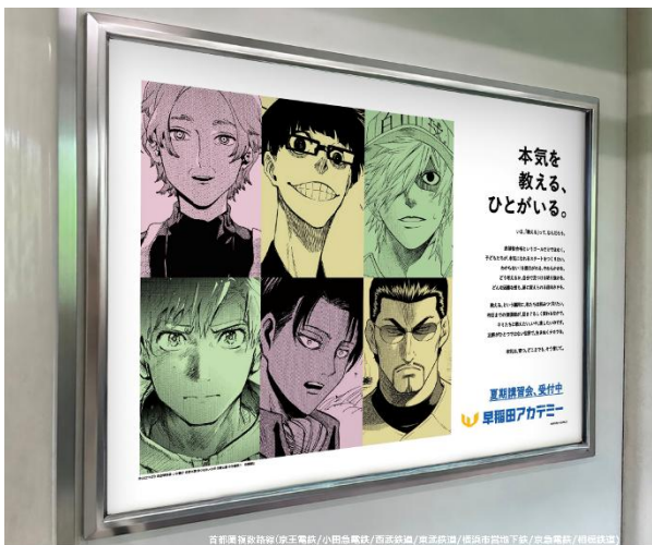
近鉄線 奈良線/東武東上線/小田急電鉄/西武鉄道/東武東上線/東武東上線/東武東上線/東武東上線/東武東上線/東武東上線 ©山口つばさ ©金城宗幸・村優介 ©清水貴 ©つるまいかだ ©鎌山創 ©寺嶋裕二 ©講談社 ※画像はイメージです