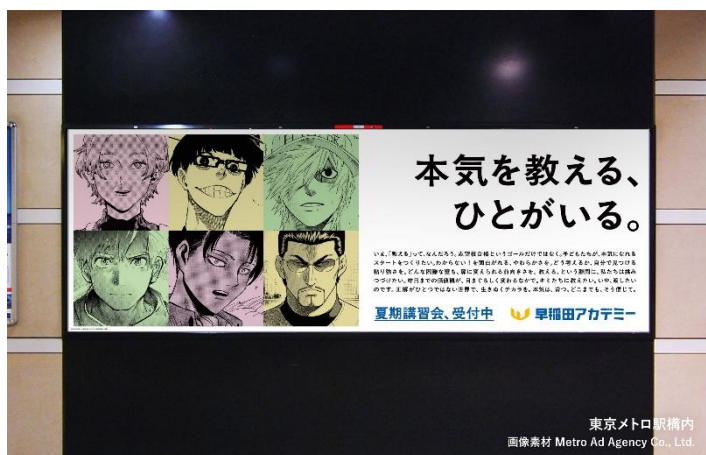
©山口つばさ ©金城宗幸・村優介 ©清水貴 ©つるまいかだ ©鎌山創 ©寺嶋裕二 ©講談社 ※画像はイメージです