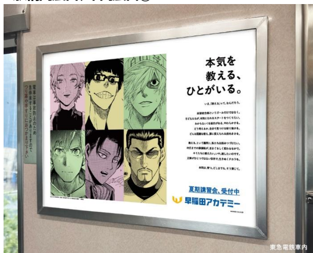
©山口つばさ ©金城宗幸・村優介 ©清水貴 ©つるまいかだ ©鎌山創 ©寺嶋裕二 ©講談社 ※画像はイメージです