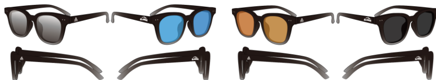
（左）ライトスモーク・ブルー・ブラウン・スモーク（右）