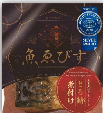
モンドセレクション銀賞受賞商品も含む、 「魚えびす™シリーズ」