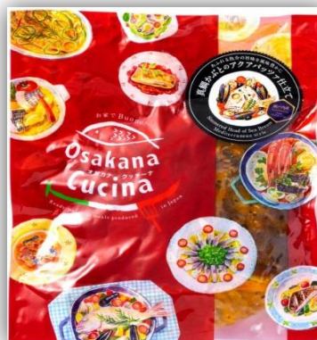
おしゃれなバルの味をご家庭で、 「Osakana Cucina™シリーズ」

(報道関係者様お問い合わせ先) 広報室 古屋、 じくはら 竺原 tel:03-3575-5753