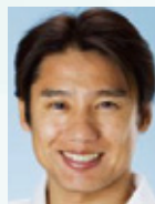
いけやま おさむ 池谷幸雄さん ソウルオリンピック体操 団体綱、個人ゆか銀メダリスト バルセロナオリンピック体操 団体綱、個人ゆか銀メダリスト