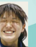
あきやまりな 秋山里奈さん ロンドンパラリンピック 100m青泳ぎ 金メダリスト