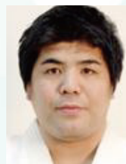
いずみ ひろし 泉 浩さん アテネオリンピック 柔道男子 90kg級 銀メダリスト