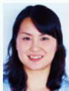
しばた あい 柴田亜衣さん アテネオリンピック水泳 800m女子自由形 金メダリスト