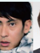
あきもとしんじ 秋本真吾さん 元陸上競技選手 200mハードル 日本記録保持者