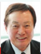
かかもとけんじ 釜本邦茂さん 元サッカー日本代表 メキシコシティ オリンピック 銅メダリスト