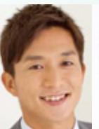
ふくにしたかし 福西崇史さん 元サッカー日本代表