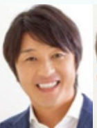
みつひろ 三浦淳寛さん 元サッカー日本代表 シドニーオリンピック 出場