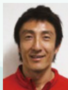
あさひろのりひさ 朝原宣治さん 元陸上 100m日本代表 北京オリンピック 4x100mリレー 銀メダリスト