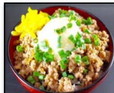
神奈川県・横浜市 / 「湘南びゅうあポークそばろ丼」 マリン