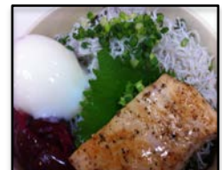
静岡県 / 「遠州灘シラス丼」 すだ屋