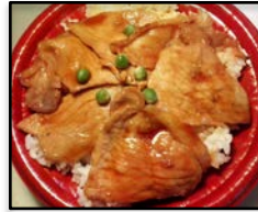
北海道札幌市 / 「豚丼」 トリプルグーブル

*その他メニュー 多数取り揃えております。 *メニューと開催都市はイメージです。