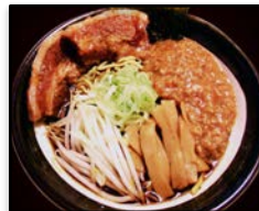
埼玉県・熊谷市 / 「香り豚らーめん」 麺屋つばさ