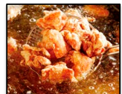
大分県「大分中津唐揚げ」 唐揚げ専門店 田むら