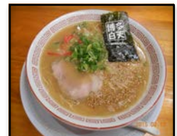
福岡県・福岡市 / 「博多ラーメン」 博多白天