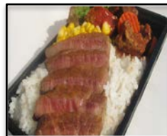
愛知県・豊田市 / 「知多牛ステーキ丼」 大阪府・東大阪市 / 「豚玉お好み焼き」 どんなもん 弁天流