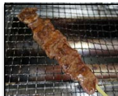
熊本県・熊本市 / 「馬の串焼き」 麦とろ人