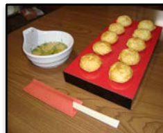
兵庫県神戸市 / 「明石焼き」 たるたる堂