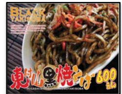
東京都 / 「東村山黒焼きそば」 多摩ケータリング倶楽部