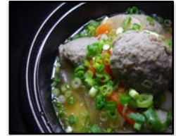
岩手県・釜石市 / 「さんまつみれ汁」 仙太郎