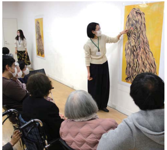
2023年度の鑑賞会の様子