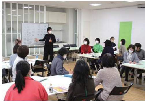
2023年度のサポーター養成研修の様子