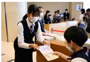
中学生プロデューサー 活動の様子