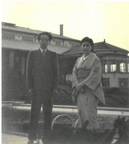
島村彦彦「大佛夫妻」1941年