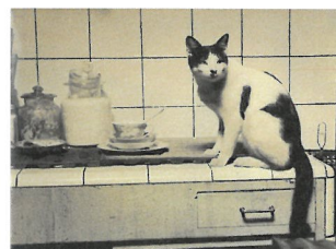
大佛次郎「台所の猫」