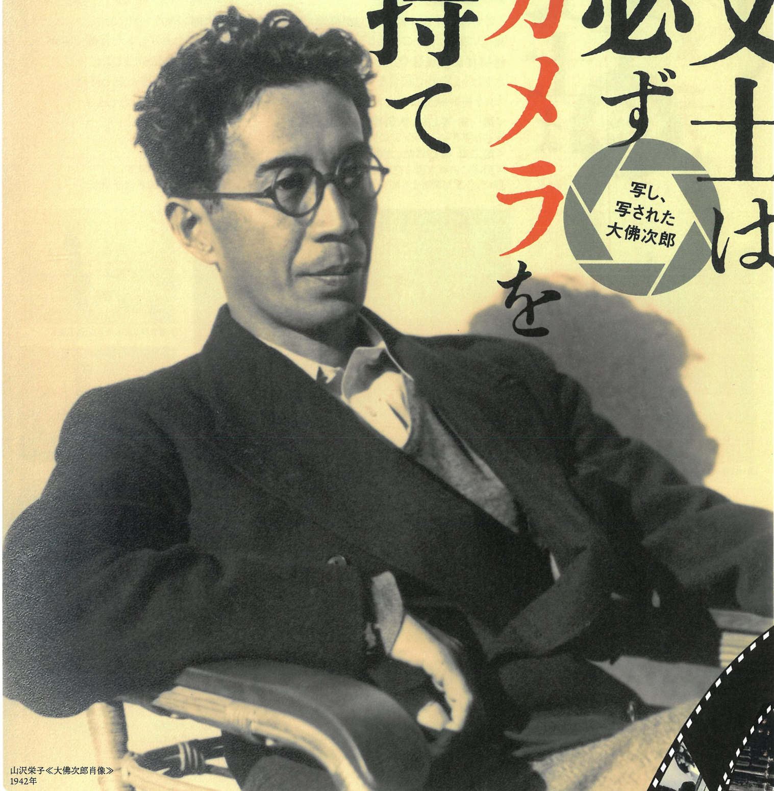
山沢栄子<大佛次郎肖像> 1942年