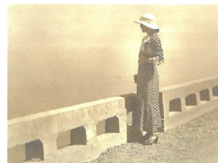
大佛次郎「海」モデル：西子夫人