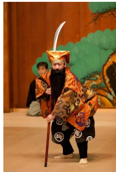
狂言「悪太郎」(和泉流)

水汲みをしたくない太郎冠者が清水の鬼に扮して主人をおどかす様子が面白い「清水(しみず)」と、乱暴者の悪太郎を伯父がこらしめた結末に注目の「悪太郎(あくたろう)」の2曲をお送りします。