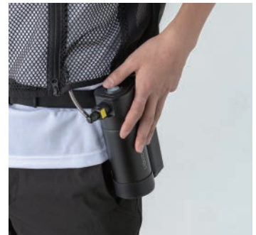
送水開始 首元のチューブから冷却水が染み出し、清涼感が得られます。