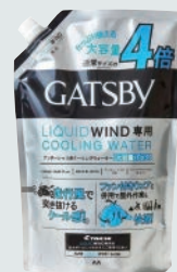
N26-04 ギャツビー リキッドウインド ウォーター 1,200ml