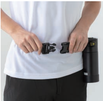
保冷ボトルのセッティング 冷却水を入れた保冷ボトルを腰に固定します。