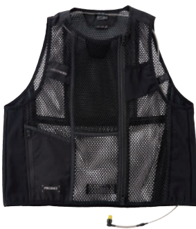
N26-01 リキッドウインド スースクールベスト サイズ:S/M/L/XL/XXL カラー:ブラック 材質:ポリエステル100% 付属品:送水チューブ