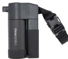
N26-02 リキッドウインド 保冷ボトルキット (電動) カラー:ブラック 材質:本体/ABS、ボトル/ステンレス、カプラ/POM サイズ:W127.2×D72.1×H195.2mm 重量:468g(冷却水含まず) 電池:リチウムイオン電池(3.7V 2,000mAh) 内蔵バッテリー容量:2000mAh/3.7V 充放電:約300回※バッテリー交換不可 充電時間:約6時間(出力電流500mA以上の充電器を使用した場合) 防水:IPX4