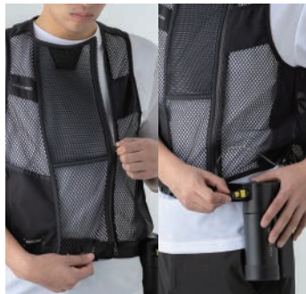
ベスト着用+送水チューブを つなげる

Tシャツなどのアンダーウェアの上に専用ベストを着用し、チューブのジョイントと保冷ボトルをつなげます。 ※ 接続の際、ボトル側のジョイント部をきつく締めすぎないようにご注意ください。