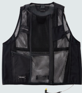
N26-01 リキッドウインド スースクールベスト