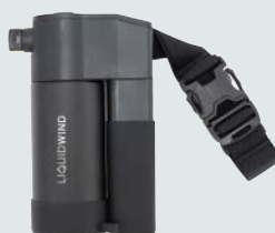
N26-02 リキッドウインド 保冷ボトルキット電動