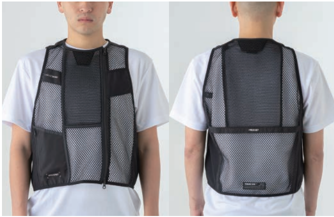
モデル身長：178cm 着用サイズ：Lサイズ