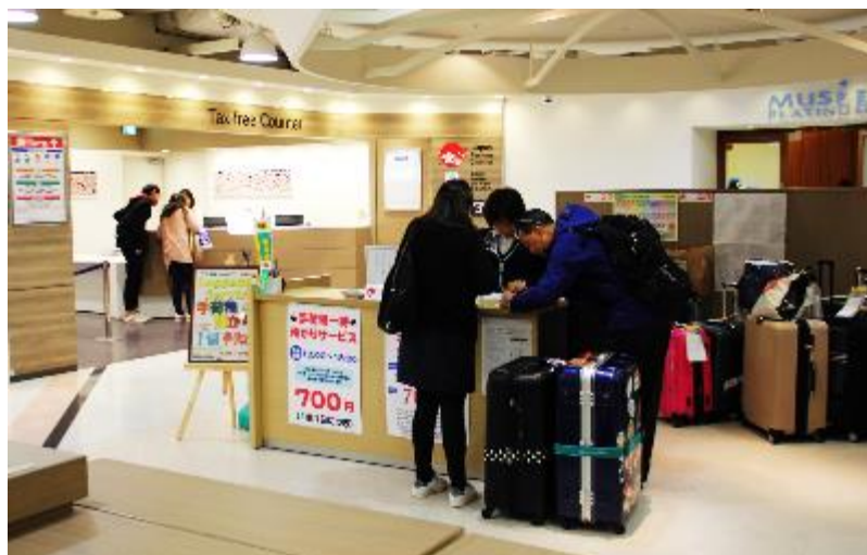
なんばCITY 地下2階 宅急便カウンター

南海電鉄とヤマト運輸は、平成28年9月から難波駅直結の商業施設「なんばCITY」地下2階で手荷物一時預かりサービスを行っています。nest 開業後も引き続き営業いたしますので、こちらもぜひご利用ください。