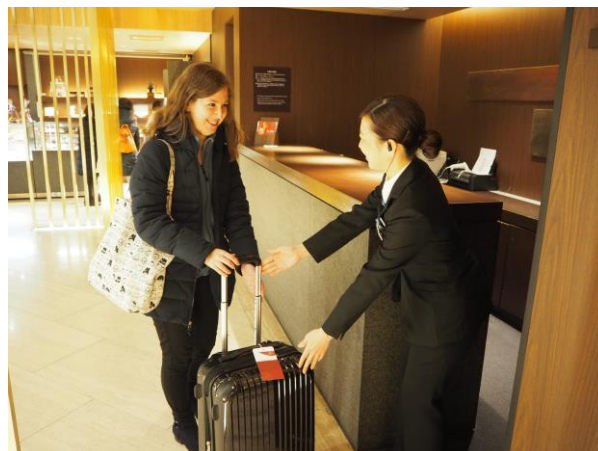
当日中に大阪市内のホテルで手荷物が受け取れます。