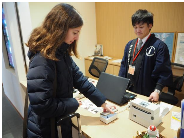
手荷物を預けるときは「SOZORO」のカウンターで、2次元コードかざすだけで送り状が発行できます。

いままでのように重い荷物を持ったまま移動することなく、身軽に観光を楽しむことができます。また、事前にウェブから申し込めることから、特に外国人のお客さまにとってネックとなる送り状の記入が不要となり、スムーズに宅急便ご利用いただけるようになります。