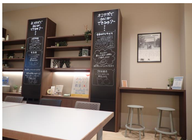
【ネコサポステーション テラスモール松戸店 サービスカウンター・コワーキングスペース】