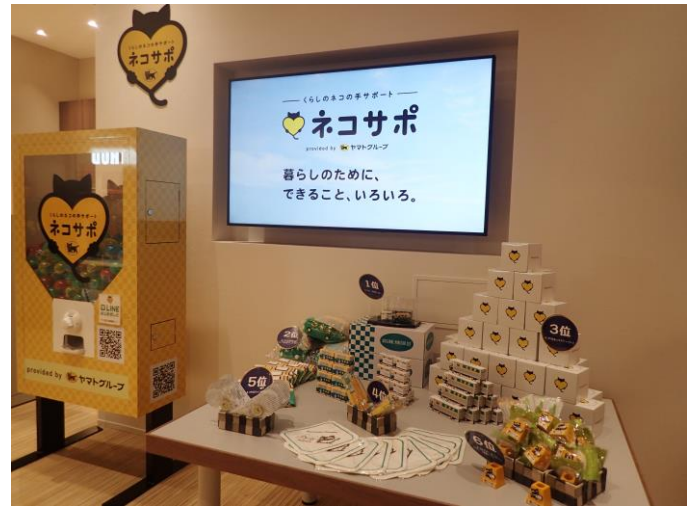
【ネコサポステーション テラスモール松戸店 イベントスペース】