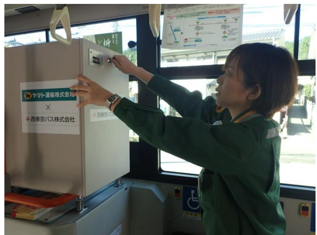
宅急便をバスボックスに搭載する様子