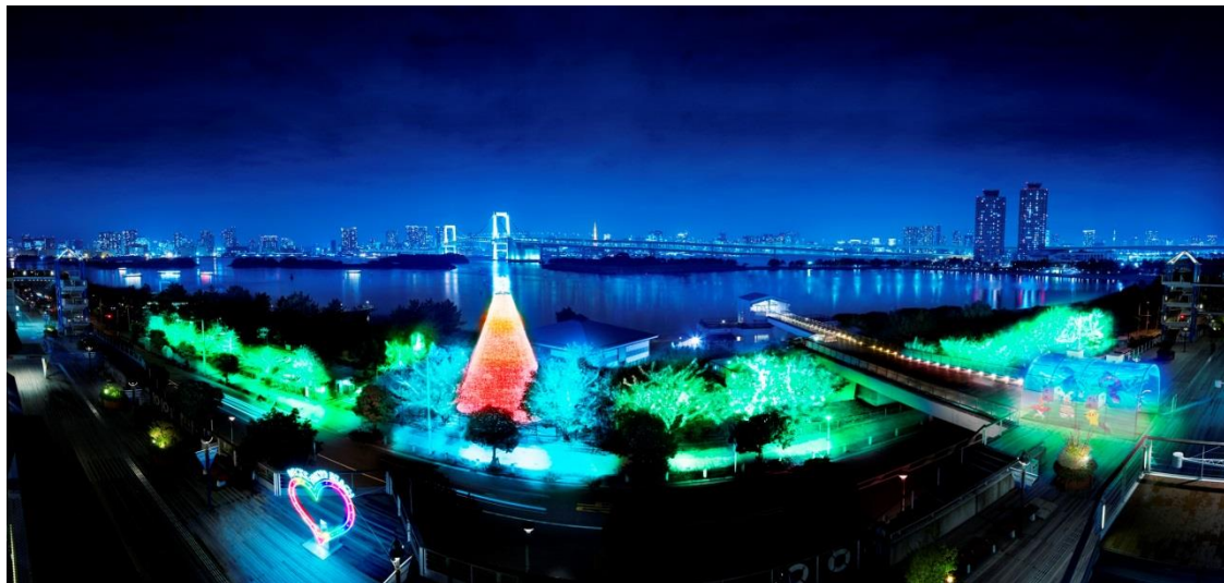
左手前：「ピカチュウ＆マジアナのハート型フォトスポット」、奥：「樹木イルミネーション」、右：「ILLUSION DOME」イメージ

「ポケモン映画」の世界観を表現した特別バージョンで「デックス東京ビーチ」の通年点灯型イルミネーション「お台場イルミネーション“YAKEI”」が点灯します。