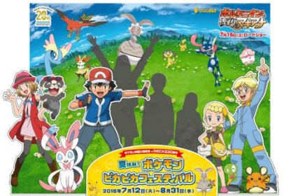
※フォトスポットイメージ

館内3箇所のフォトスポットにいるポケモンをすべて探し出し、その数を当てると、豪華賞品をゲットできるラリー企画を実施します。参加賞の「デックス限定ポケモンうちわ」は、ポケモンの数を答えると先着・無料で進呈。さらに館内の対象店舗を利用し、ポケモンの数を正解した方の中から抽選で、デックス限定のポケモンオリジナルグッズなど豪華賞品をプレゼントします。