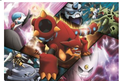
※映画ビジュアルイメージ