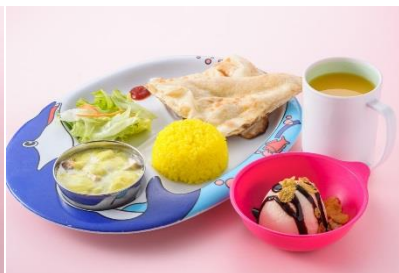
カザーナ「キッズセット」680円(税込)