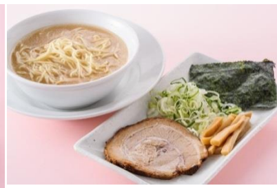
よってこや「お子さまラーメン」380円(税込)