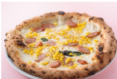
Trattoria Pisseria LOGIC 「Pizza/バンビ」1, 680円(税込)