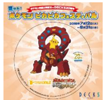
「デックス限定ポケモンオリジナルステッカー」全4種